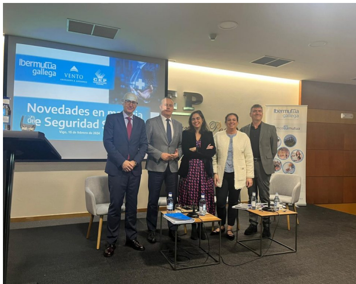
Vigo, 15 de febrero de 2024

Además, en las jornadas se abordaron también las obligaciones para las empresas, contenidas en la Ley Orgánica 15/2022, de 12 de julio, integral para la igualdad de trato y la no discriminación, y se trataron igualmente las repercusiones prácticas originadas tras los últimos pronunciamientos judiciales relativos a los despidos de trabajadores en situación de baja médica, o los despidos que se producen tras una declaración de incapacidad permanente.