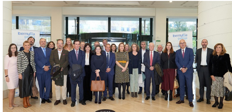
La Junta Territorial de Ibermutua en Galicia, está compuesta por 31 empresas mutualistas de la Comunidad Autónoma, representantes de todos los sectores de actividad económica gallegos: Aceites Abril, Afyt Aseores, Altia, Civis Global, Confederación de Empresarios de Galicia, Constructora San José, Corporación Radio y Televisión de Galicia, Desarrollo Obras y Servicios, Diputación de Lugo, Diputación de Ourense, Epifanio Campo, Gestoría de la Torre, Grupo Babé, Grupo Leche Rio, Grupo Malasa, Grupo Nueva Pescanova, Instituto de Formación Financiera y Empresarial (IFFE Business School), Inversiones Tindaya, Jealsa Rianxeira, Laboratorios Valenzuela, Luckia Gaming Group, Puerto de Celeiro, R Cable, Ribera Salud, Rodman Polyships, Talleres Piñeiro, Tecnologías Plexus, Transportes Marítimos y Fluviales, Universal Support, Vento Abogados y Xunta de Galicia.