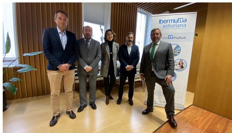
La Junta Territorial de Ibermutua en Asturias, compuesta por 24 empresas mutualistas del Principado de Asturias: Alvargonzález Contratas, Asociación Jóvenes Empresarios, Ayuntamiento de Avilés, Ayuntamiento de Gijón, Ayuntamiento de Oviedo, Cafento, Caja Rural de Asturias, Cámara Oficial de Comercio, Industria, Servicios y Navegación de Oviedo, Colegio de Graduados Sociales de Asturias, Corporación Alimentaria Peñasanta, Editorial Prensa Asturiana, Electricidad Cabielles, Garvasa Logística, Gobierno del Principado de Asturias, Grupo Duro Felguera, Grupo García Rodríguez Hermanos, Grupo SEM, Hijos de Luis Rodríguez, Izertis, Mercadona, Real Grupo de Cultura Covadonga, TSK, Universidad de Oviedo y Vaciero.