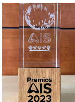
Ibermutua, Premio Especial AIS 2023 Por su compromiso con la accesibilidad