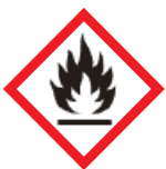
Peligro de incendio