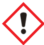
Peligro para la salud