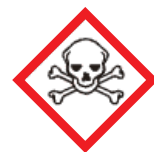
Toxicidad aguda (cutánea y por inhalación) / Irritación cutánea y ocular / Efectos narcóticos