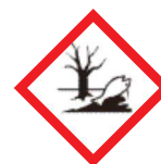
Peligroso para el medio acuático