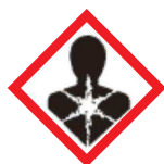
Peligroso por aspiración